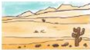
Del sol en el desierto