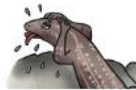
De una lagartija